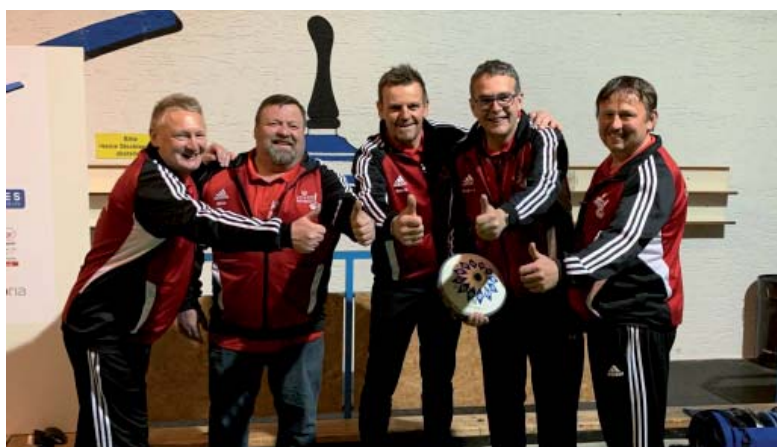
Strahlende Gesichter bei Arnsreits Stockschützen nach dem 7:3-Erfolg in Lichtenberg.

tenberg nach, wo man sich mit einem starken Auftritt nach der Pause mit demselben Ergebnis durchsetzen, und so weitere wichtige Punkte sichern konnte. Nach der Hälfte der Vorrunde lacht unsere Mannschaft damit sogar von Platz eins ihrer Gruppe, und geht somit als Tabellenführer und mit jeder Menge Selbstvertrauen in die am 21. Mai beginnenden Heimspiele.