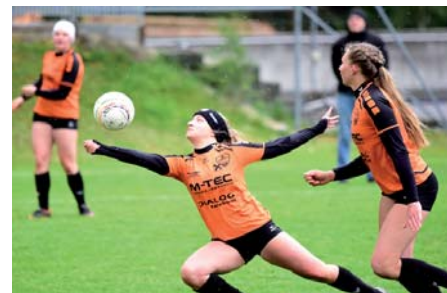
Arnreits Faustballdamen sind im Frühjahr ohne Abstiegssorgen, und können im Meister Play-Off befreit aufspielen

Enns eingestuft werden. Vier Spiele lang hat unsere Mannschaft noch die Möglichkeit, um in einer gewohnt ausgeglichenen Liga wichtige Punkte im Kampf um den Ligaverbleib zu sammeln.