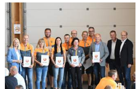
Im Rahmen der 50-Jahr-Feier wurden langjährige Funktionäre des Sportvereins für ihre Verdienste gewürdigt.