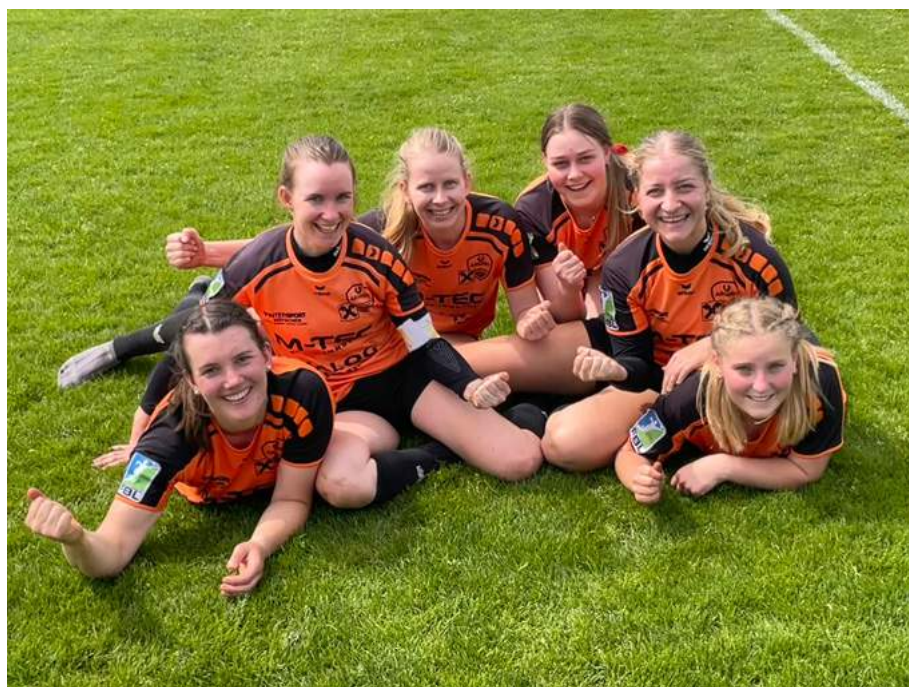
Einen perfekten Start in die Feldmeisterschaft legten Arnreits Faustball-Ladies hin.